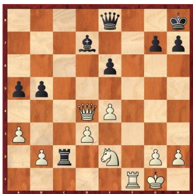
Cerclier Léo vs Titouan Bonnet Les blancs jouent et