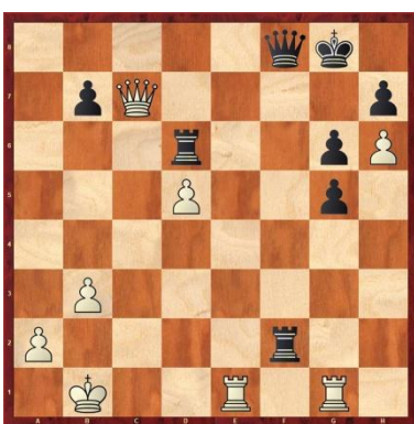
Frederic Letemple vs Alain Luco Les blancs gagnent