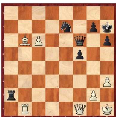
Titouan Bonnet vs Arnaud Caillot Les blancs gagnent