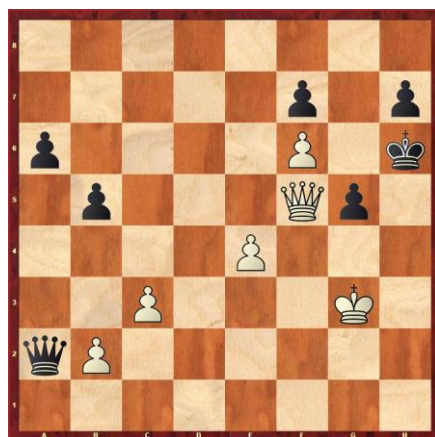
Les blancs jouent et gagnent – Nouvel vs Priser 2. Difficile (plus dur que ça en a l'air)